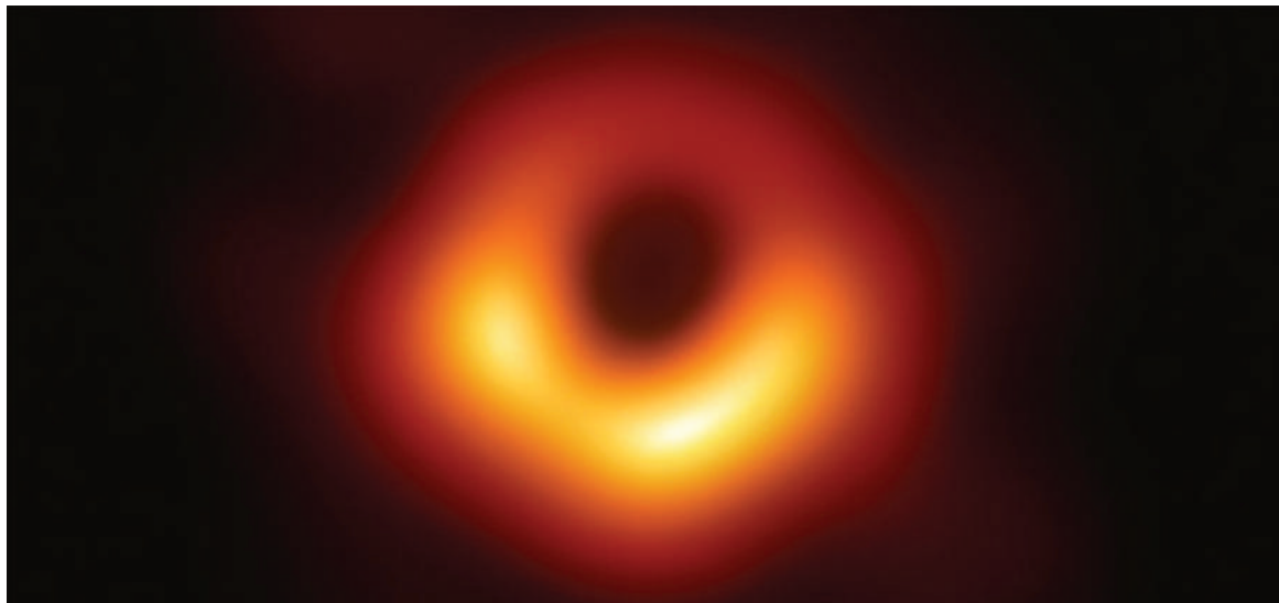
Fig. 2. Primeira imagem da sombra de um buraco negro no centro da galáxia Messier 87 pelo Event Horizon Telescope .

ções extremas na densidade de matéria primordial. Estes buracos negros poderiam variar em tamanho e são potenciais candidatos a explicar a matéria escura, uma componente misteriosa que compõe grande parte da massa do universo. Embora os buracos negros sejam invisíveis, podemos detetar os seus efeitos no espaço ao seu redor. Um método de deteção é por meio de ondas gravitacionais : ondulações no tecido do espaço-tempo geradas pela violenta colisão de, por exemplo, dois buracos negros, num processo espiral de aproximação e fusão final. Embora imperceptíveis na vida quotidiana, instrumentos com extraordinária sensibilidade, como o LIGO e o Virgo, conseguem senti-las. A primeira deteção aconteceu em 2015 e tornou-se uma descoberta revolucionária, confirmando as previsões teóricas de Einstein um século antes. Em maio de 2019, a humanidade teve a sua primeira visão direta de um buraco negro, localizado no centro da galáxia Messier 87 , a cerca de 55 milhões de anos-luz da Terra.